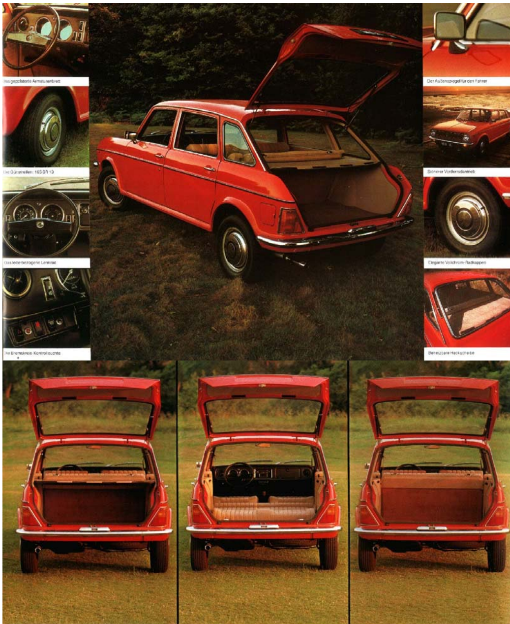
Das gepolsterte Armaturenbrett