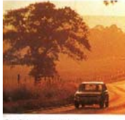
Gute Sicht nach allen Seiten