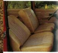
Die bequemen Liegesitze