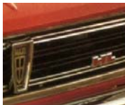
Der neue HL-Kühlergrill

HL-Styling: Mattschwarzer Kühlergrill mit HL-Symbol und Chrom-Einfassung. Stoßstangen-Hörner mit Hartgummi-Auflage. Verchromte Auspuffblende. Elegante Vollchrom-Radkappen. Und natürlich die unverwechselbare klassische Maxi-Silhouette.