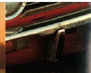
Spezielle Stoßstange mit Hartgummi-Auflage